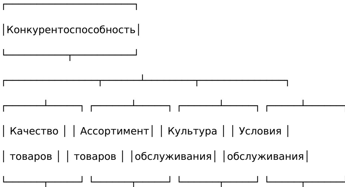
Рис. 1. Иерархическое представление проблемы конкурентоспособности предприятия

связано с тем, что конкуренция на каком-то конкретном локальном рынке будет на определенном уровне для всех предприятий.